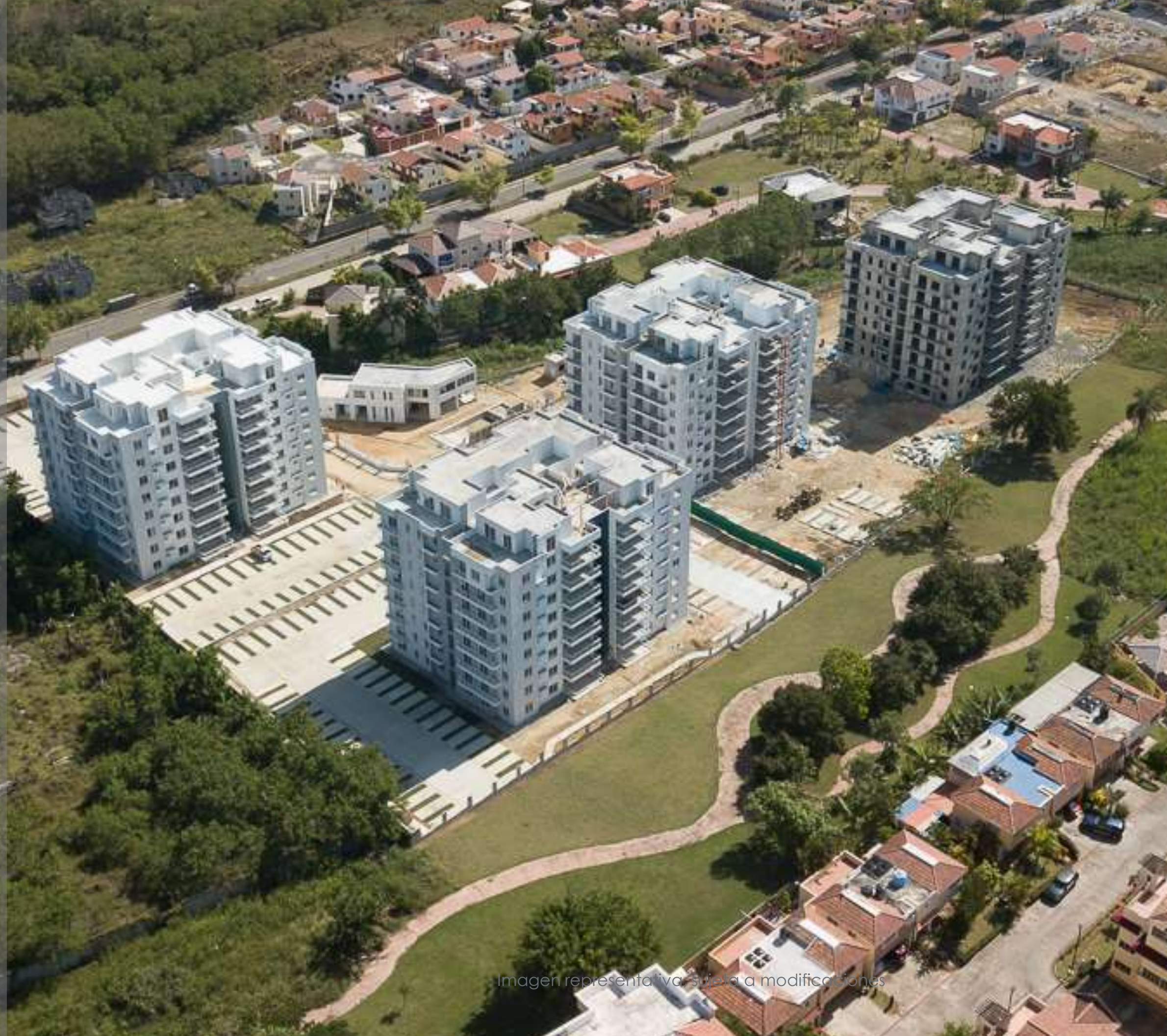
Imagen representativa sujeta a modificaciones