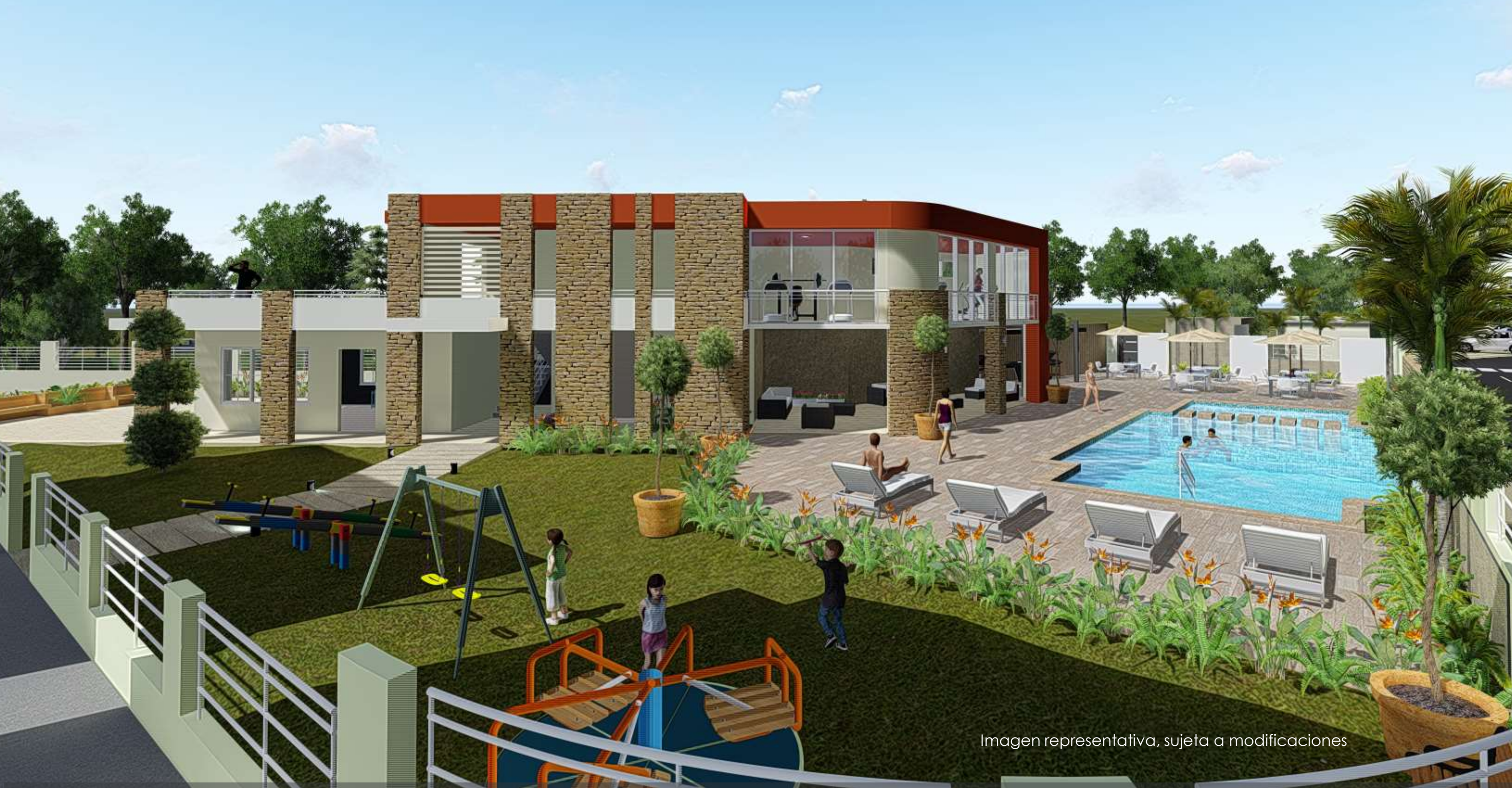
Imagen representativa, sujeta a modificaciones